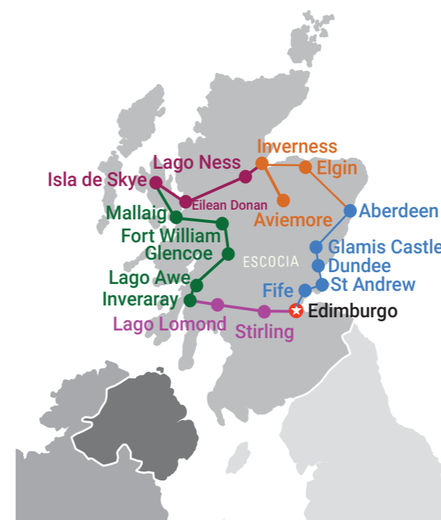
Tesoros de Escocia